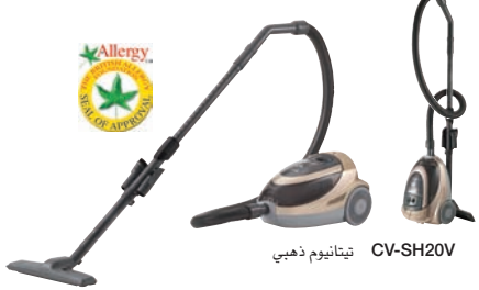
تيتانيوم ذهبي CV-SH20V