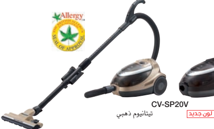
تيتانيوم ذهبي CV-SP20V