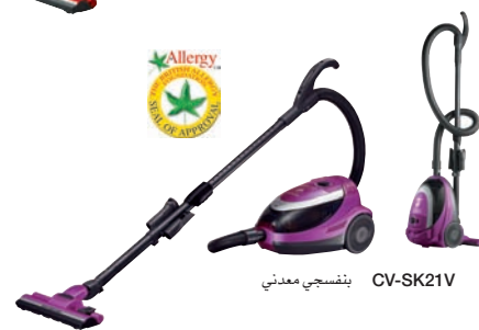
بنفسجي معدني CV-SK21V