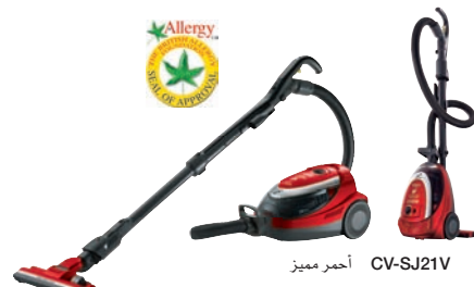
أحمر مميز CV-SJ21V